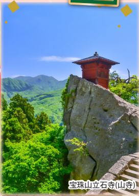
宝珠山立石寺(山寺)